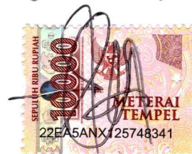
Euodia Filipia Mosse