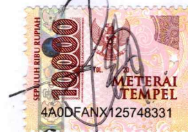
Euodia Filipia Mosse